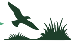
ZSC NATURA 2000 IT7110092