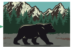
PARCO NAZIONALE d'Abruzzo, Lazio e Molise

CONTINUITÀ ECOLOGICA: UN CORRIDOIO VITALE PER LA BIODIVERSITÀ