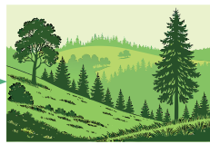
RISERVA NATURALE Regionale Monte Salviano